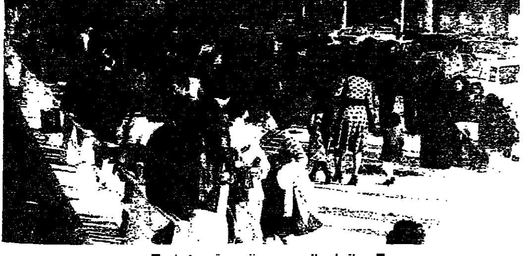
حلقات البروسين منفسرة وجماعية

عطلة البحر تخضع الفضوليين تمتع الشمس للناس . ومنصة الشاطئ ، للاحلام . هذه المجموعات التي خرجت من بيوتها للاقاء البحر في عطلة الاسبوع ، كانت تحيي ما يطيب لها بعد انجاس : تقيم حلقات من الكوريات في ما بينها ، او محطت انتظار لبعضها البعض ، او تحضن الاطفال على طول الجناح الغربي . لكن الشيء الملائم والخالق في هذه العطلة هو البحر . هذا الوردع الازرق الذي يحضن الياسة ولا تتعبه احلام الفضوليين . فهذا الحلم الذي يقف ، قريبا من موج المتوسط ، ساحت عيشاه في البعيد ، خارج حلقات البروسين الجماعية ، واحب ان يناجي البحر على طريقته الخاصة .